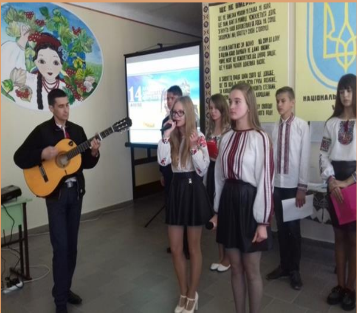
Виховний захід «Бо тільки той є справжнім Сином, Хто вміє Неньку захистити»